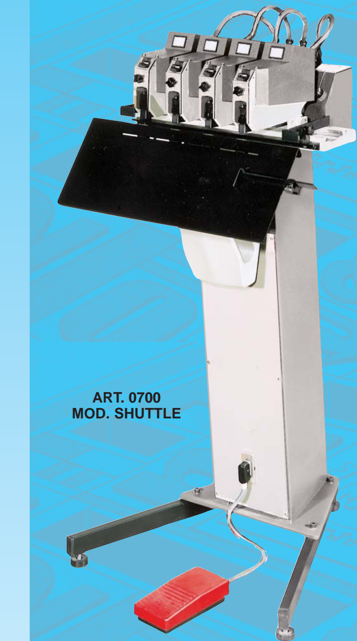
ART. 0700 MOD. SHUTTLE

The COLUMBIA uses the whole range of standard staples series 50 and 24, including button-hole and will staple thicknesses ranging from a minimum of one sheet up to a maximum of 17 mm. The stapling head is standard throughout the range and the base varies for different applications as