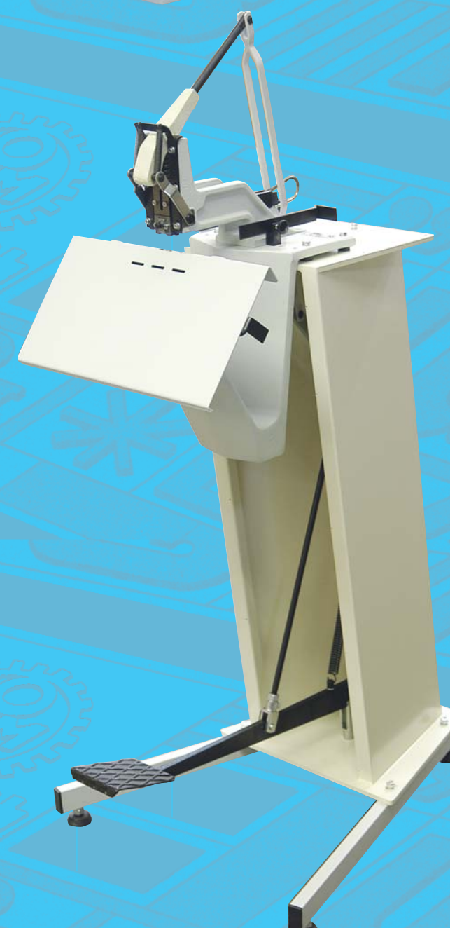
ART. 0630 MOD. COLUMBIA G