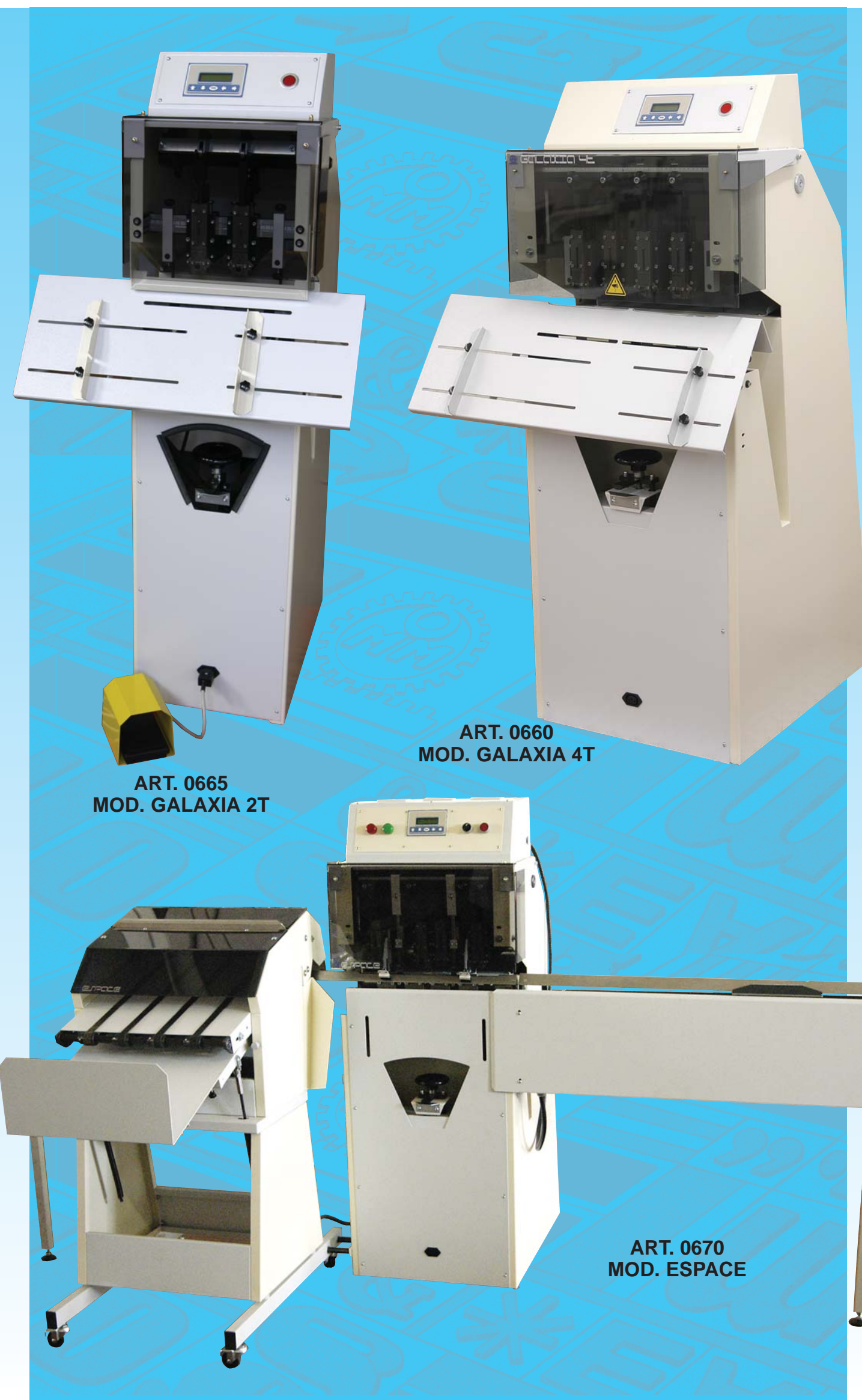
ART. 0665 MOD. GALAXIA 2T