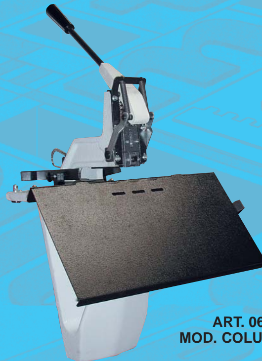
ART. 0610 MOD. COLUMBIA C