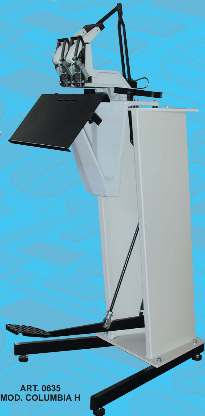
ART. 0635 MOD. COLUMBIA H