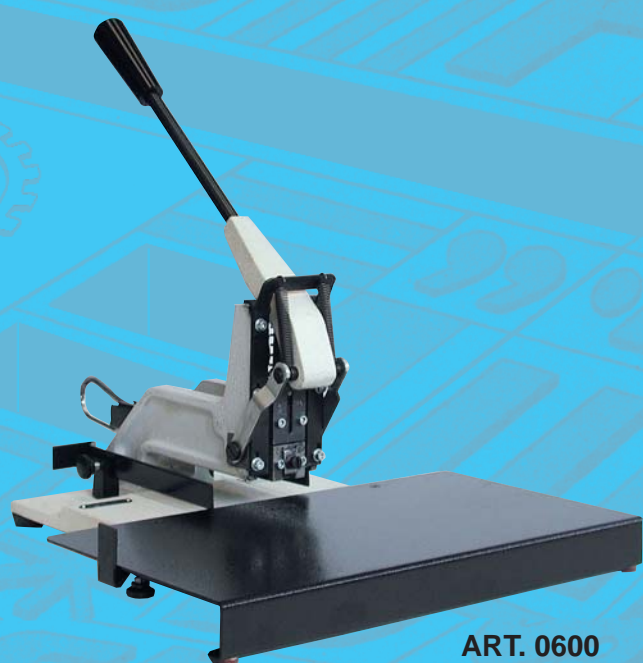
ART. 0600 MOD. COLUMBIA A