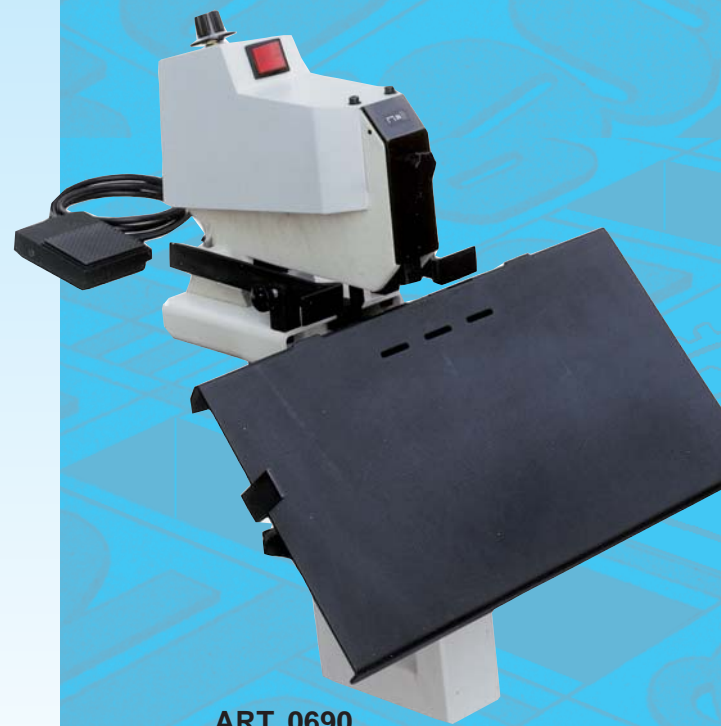
ART. 0690 MOD. MICROSHUTTLE