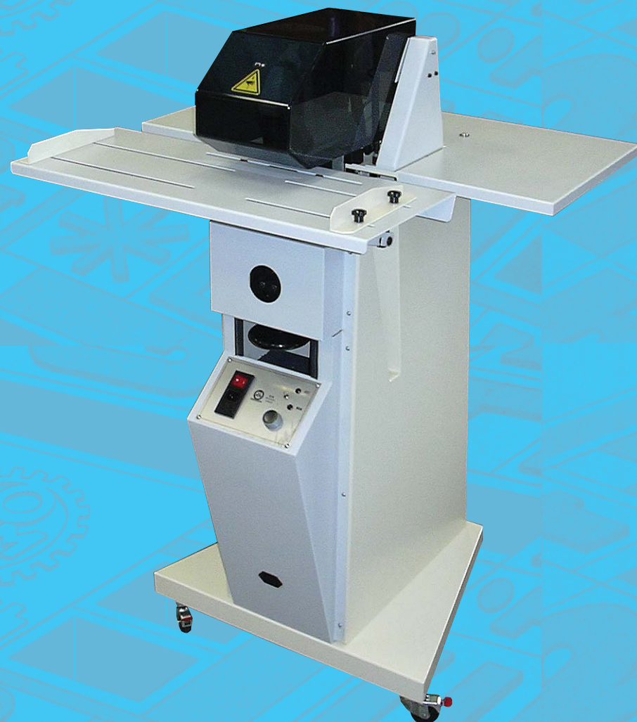
ART. 0640 MOD. COLUMBIA M1